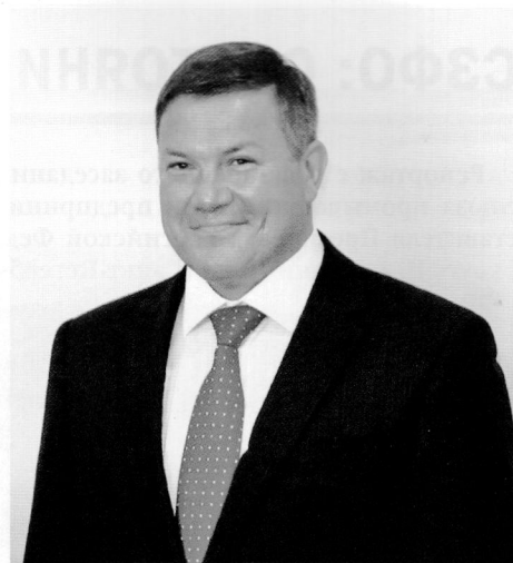
О. А. Кувшинников

– Мы отмечаем положительную динамику торгово-экономических связей наших регионов. По данным государственной статистики в 2011 году поставлено продукции из Вологодской области в Санкт-Петербург на сумму более 19 миллиардов рублей (в 2010 году – на 12 миллиардов). Из Санкт-Петербурга в Вологодскую область поставлено продукции почти