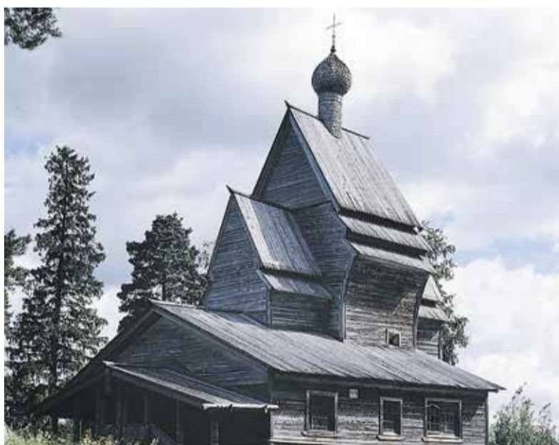
Рисунок 2. Посиврье. Дер. Юковичи (Родионово). Георгиевская церковь. 1493 г.