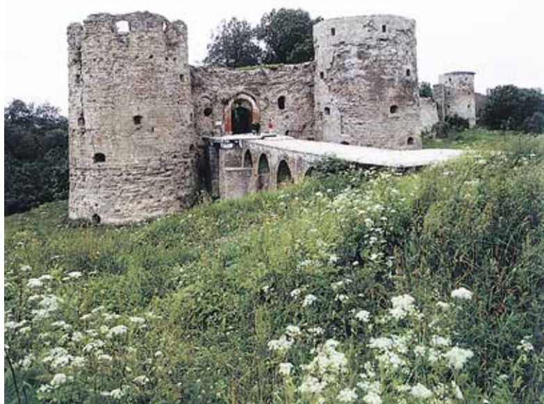
Рисунок 3. Копорская крепость, заложена в 1237 г. Объект Всемирного наследия ЮНЕСКО